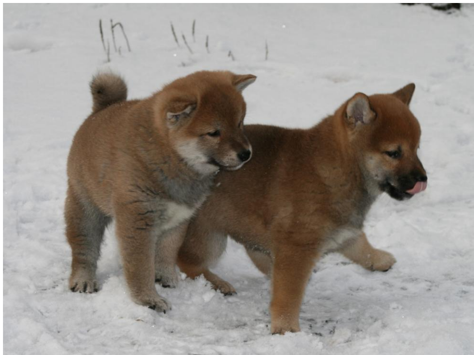
Vi koser oss ute i snøen

Hvem skal vi egentlig selge slike innavlede/linjeavlede valper til???