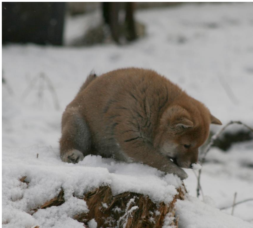
Nesa mi blir kald! – fra Laila Nagel