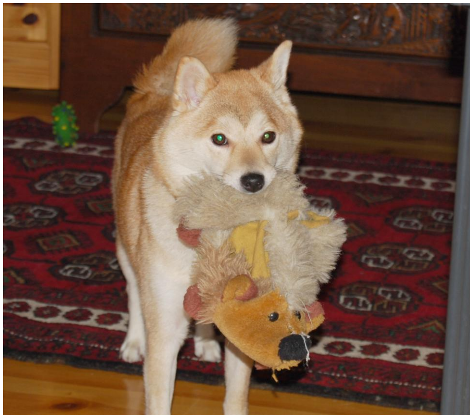
Kan noen leke med meg? fra Terje Håheim