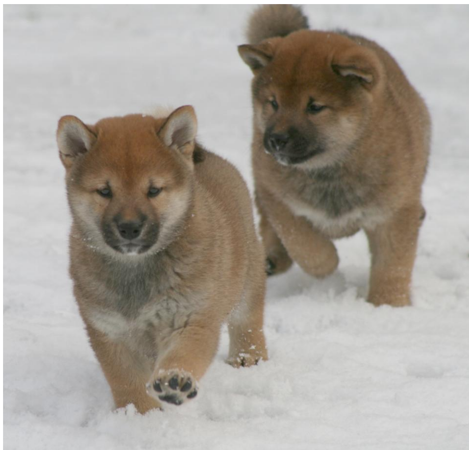
Valper i full fart – fra Laila Nagel.