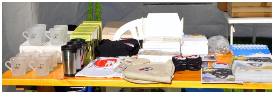
.. sammen med klubbens effekter.