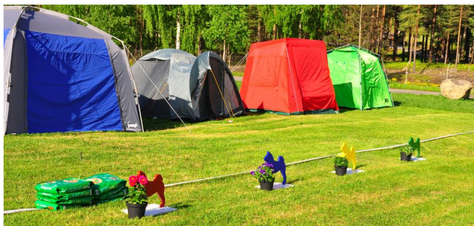
Ringene er klar for utstilling