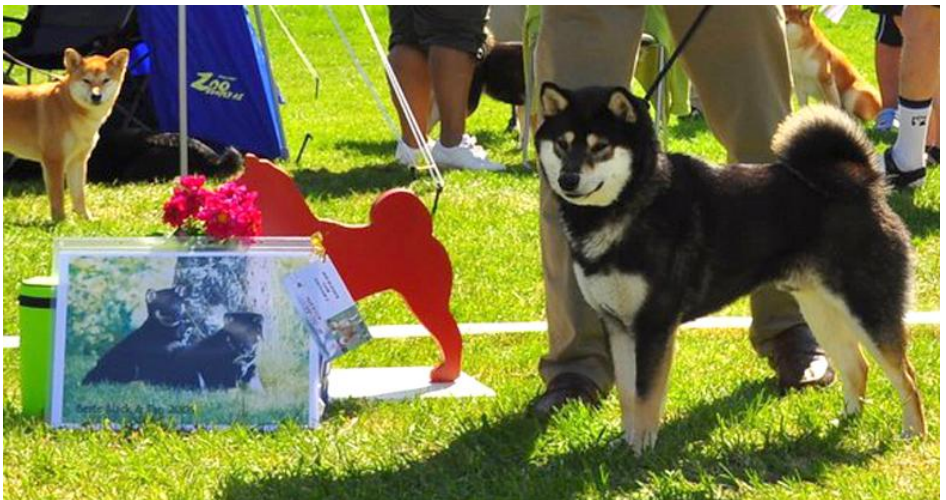
Under: Beste black&tan, Asa No Kuroteru Go Av Enerhaugen, Christen Lang