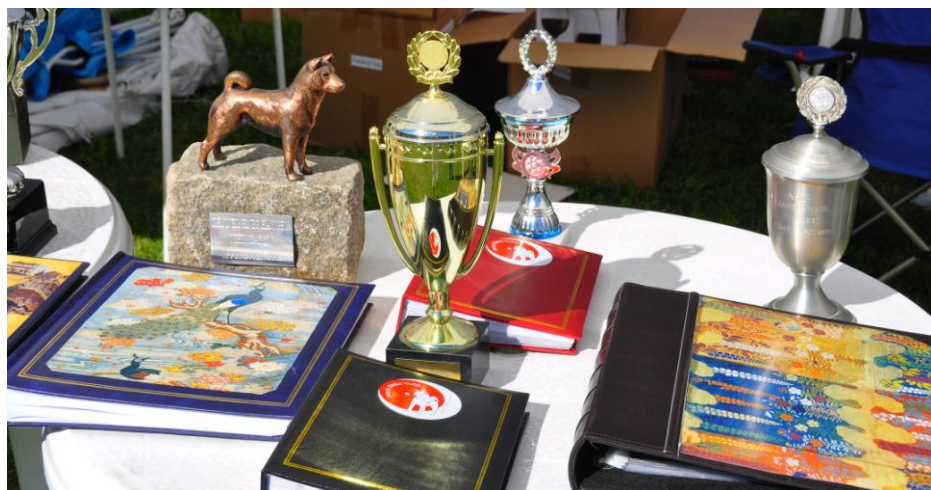
Klubbens vandrepremier ble vist frem i sekretariatet..