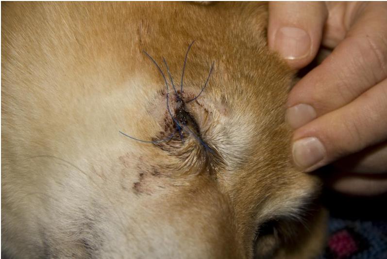
Kiichis opererte øye.

Veterinærer rapporterer ikke inn diagnosen glaukom til de nasjonale kennelklubbene, på samme måte som resultater fra vanlig øyelysning. Raseklubber får derfor ikke informasjon om hunder som rammes av denne sykdommen. -Red.anm