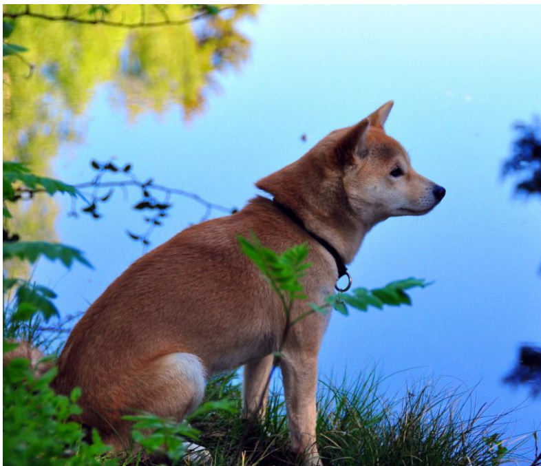
My nyter naturen

Utenlandske resultater som ønskes tellende på listen må sendes til eirik@shibatroll.com For resultater i Finland, Sverige og Danmark er det nok å vise til utstilling, sted og dato. Resultater fra øvrige land må dokumenteres med kritikk og komplett katalog.