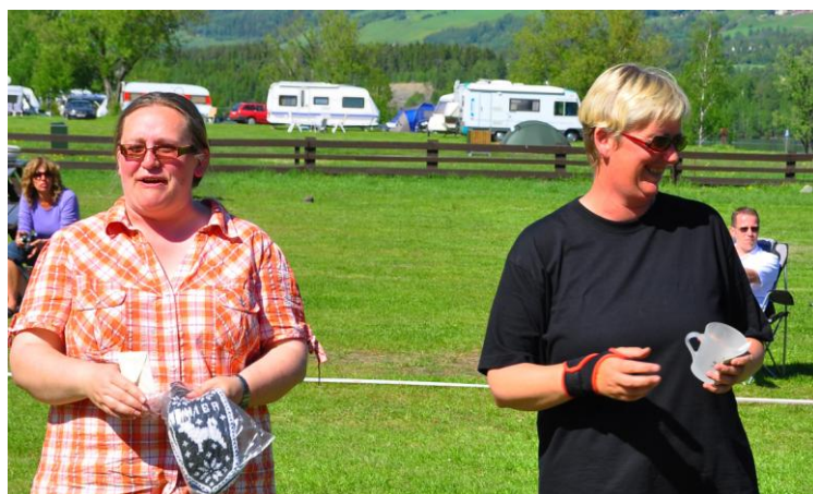
Utstillingskomiteen, som ble ringsekretær og skriver....