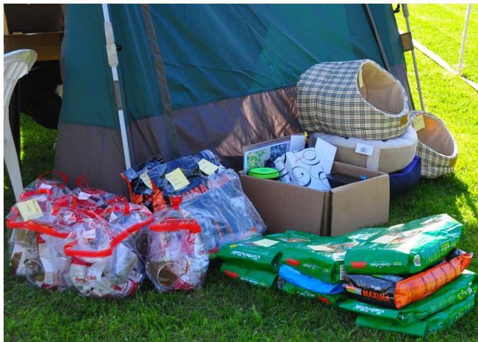
Vi hadde mange premier som ble delt ut i ringen