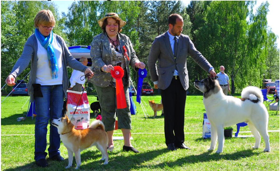
BIS veteran, raser og navn, se forrige side