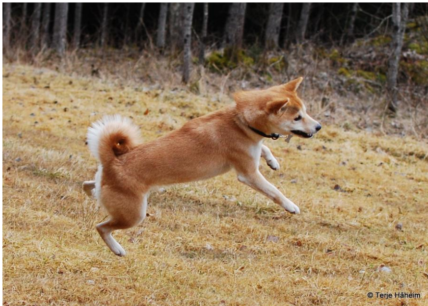
My - den flyvende shiba...