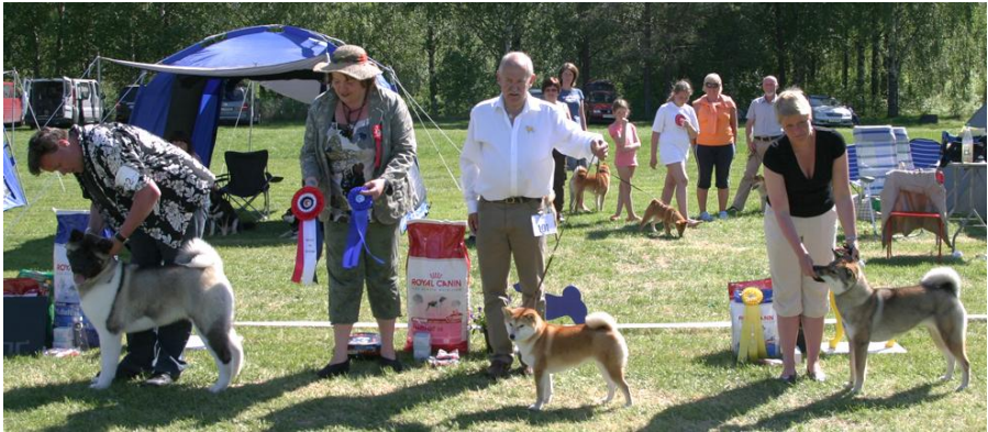
BIS, raser og navn, se forrige side