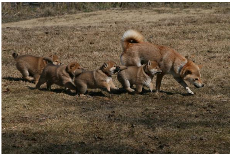
Shibavalper på tur