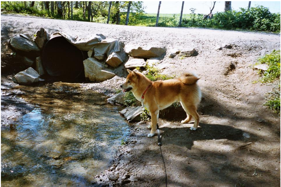
Soldoggen's Imeil Son Goku

Dette var bare litt av masse om min Shiba. Jeg har hatt andre raser og må si at Shiba er min rase nå. Hvis man godtar litt egenvilje og ikke er ute etter en robot som gjør alt du sier så er det en super rase.