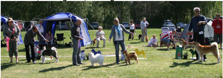
BIS valp, raser og navn, se forrige side