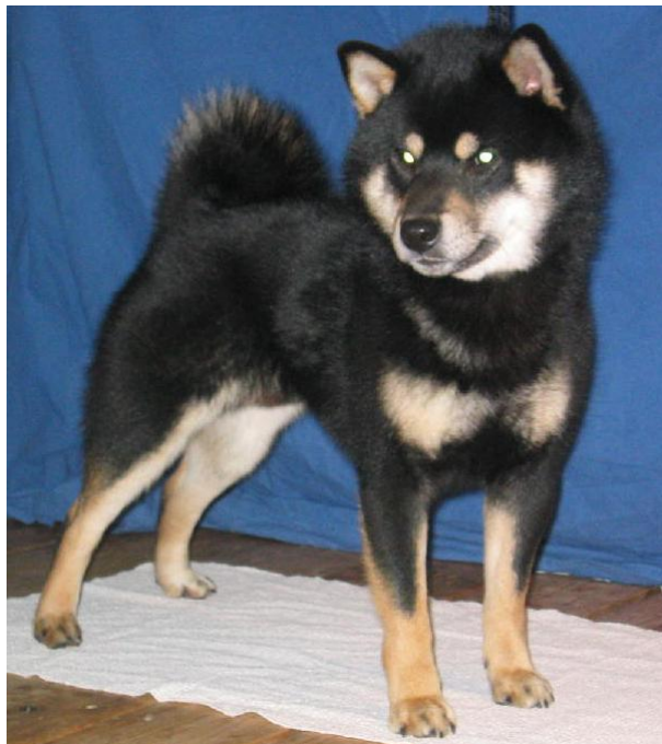
En korrekt tegnet black&tan der urajiro i brystet er markert som en falk

En dårlig rød hund (brun eller beige) uten tilstrekkelige kontraster = Urajiro vil kunne gi en dårlig tegnet B&T hund da Urajiro jo også er arvelig likegyldig på hvilken farge den viser seg.