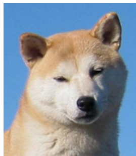
Hvit maske /klovnemaske