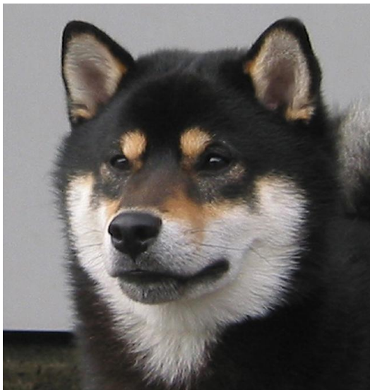
En korrekt tegnet black&tan. Man ser tydelig tanfarge på snuteryggen og i 3.øye-flekkene. I tillegg ser man tantegninger rundt ørekantene.

Tan fargen må være dyp orange - rød, verken brun eller beige.