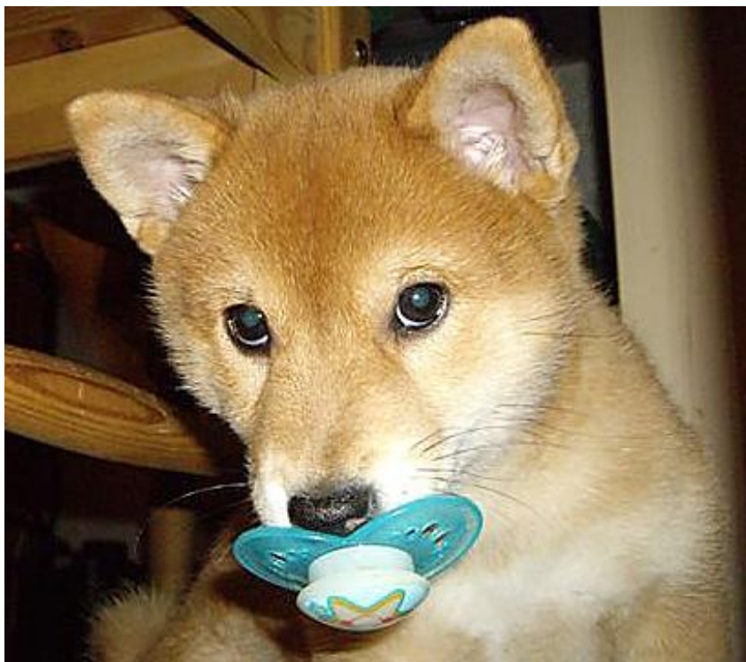
Jeg deler ikke sutten min med en ny baby, altså....

18 Hva sa oppdretter om forholdet barn/shiba, og ble det sånn? Det var det aldri noe snakk om da jeg ikke kunne få barn ☺ He he.