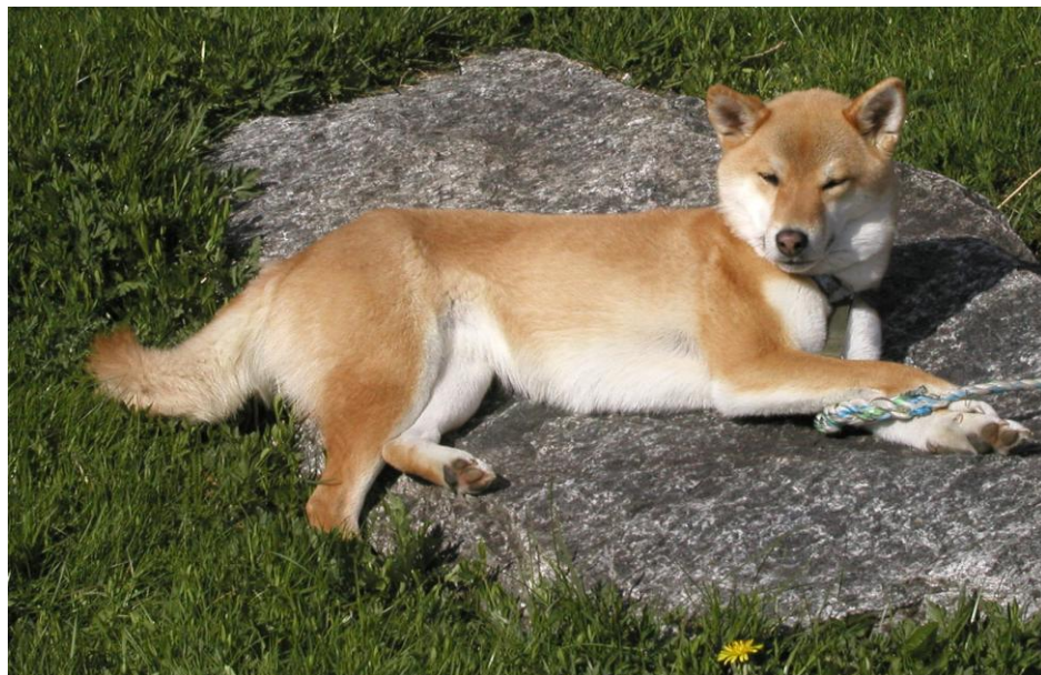
Rød hund med urajiro; "Hvit på undersiden"

(Illustrasjonsbilder fra Solvor Nærland, Sissel Skjelbred, Lisbeth Høyem, Geir Aasheim, Jorun Kvalheim, Dag Sverre Grønmyr, Christen Lang. Alle bilder kommer i farger i nettversjonen av Shib-a-visa som legges ut på hjemmesiden )