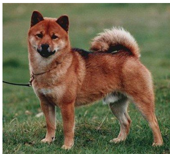
Hund med for dårlig urajiro