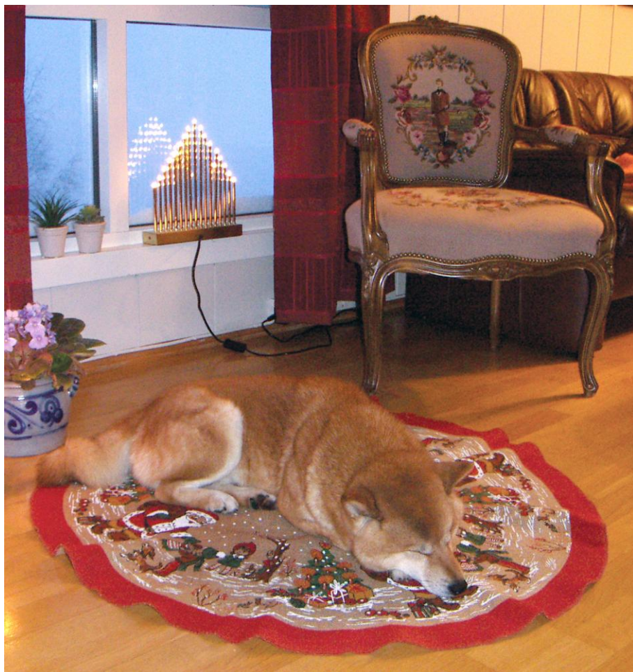
Juletematte??? Nei dette er en shibamatte, helt sikkert!

Studien er publisert i tidsskriftet Injury Prevention.