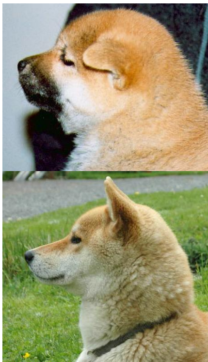
Sort maske som forsvinner. Øverst: Valp 8 uker. Under: Samme hund som voksen

Når man går inn for å standardisere en rase er det viktig å fremavle mer enhetlige hunder både når det gjelder farger og størrelse. For derved bedre å skille rasene fra hverandre. Den krem hvite fargen som finnes hos den Japanske hunden er ønsket hos Akita og hos Kishuu, hos sistnevnte er denne fargen sågar blitt helt dominerende. Tigret er en farge hos for eksempel Akita, mens denne fargen ikke finnes hos Shiba i det hele tatt.