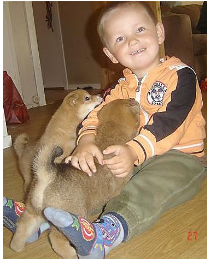
Junior leker med valpene

17 Hva bør man tenke på i forholdet barn/shiba? Gjensidig respekt