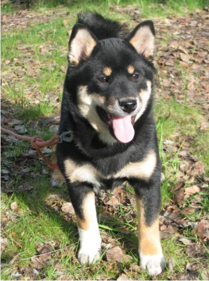
Ak-inu-bas Hayai Sakura-Hime

ØNSKER DERE ALLE EN FREDFULL JUL OG ET FREMGANGSRIKT NYTT ÅR