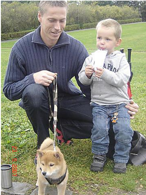
Man blir så tørst av å lufte hund....

10 Hvordan hadde dere forberedt barna på at dere skulle få hund? Gått hundekjøperkurs og møtt rasen.