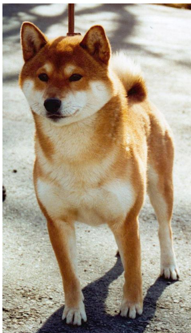
En rød hund med klart definert urajiro. Hunden har den ønskelige dype orangerøde fargen.

En Shiba kan ha hvite tegninger på følgende steder: Som strømper på forbena opp til albuen, som strømper på bak bena opp til hasen, og som en liten hvit tupp på halen.