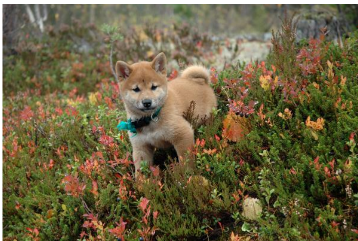
Denne valpen er nok trygt i et nytt hjem