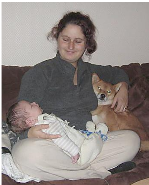
Man har da to armkroker...

16 Vil du anbefale shiba som familiehund? Si gjerne noe om hvorfor og om det er noen fallgruver man bør unngå. JEG VIL ANBEFALE SOM FAMILIEHUND, MEN KJENNER IKKE TIL SMÅBARN/BABY