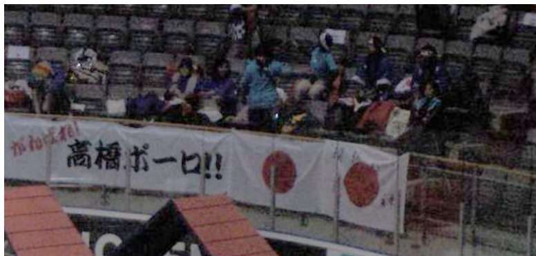
Den japanske supporterklubben

Om vi hadde lurt på hvor vi skulle sitte, ble ikke det noe problem, nei. Alle nasjoner som hadde meldt seg med supportere, hadde alt fått tildelt sine plasser. Over alt var det flagg i alle nasjoners farger, så det var bare å sette oss der det norske flagget var.