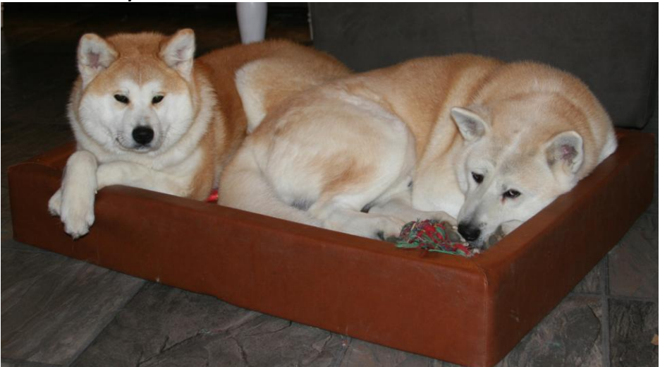
N S Uch Ak-inu-bas I-ma-ru Eikou no Hoshi & N S Uch Ak-inu-bas Ch-ima Samurai