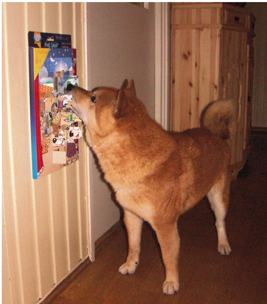
Tro hva som skjuler seg bak luken i dag..????

Sjekketur med anstand. Eneste kjente tilstelning der hunden har prioritert plass under paraplyen, til og med ved kraftig regnskyll.