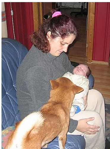
Første møtet med ny baby

6 Hvordan opplever dere shibaen ift barn i alderen 3-6 år? Helt ok