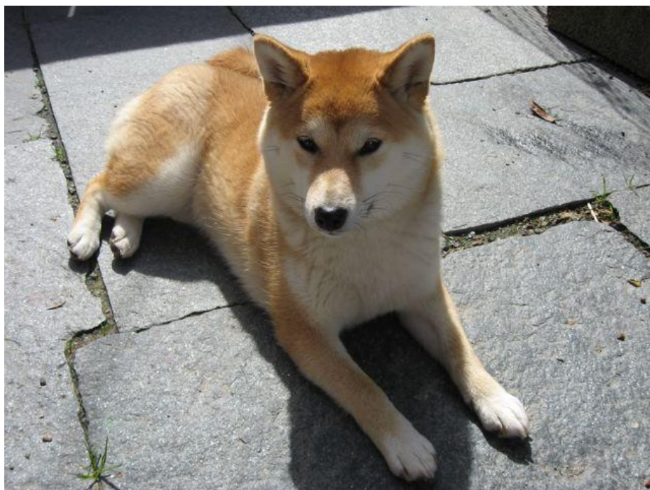
Hime nyter solen

Slike scener er nesten dagligdags i vår fredelige lille gatestump - har vært det siden hun kom til oss som lite valpeknøtt. Noen av naboene har hun lagt sin spesielle og høylydte elsk på, og alle de andre som bor i gaten hilser hun vennlig begeistret på - legger de ikke merke til henne med det samme, gir hun forsiktig beskjed om at " Her er jeg – ser du meg ikke? " Og naboene svarer villig på valpens tilnærmelser – nesten som er de beåret over oppmerksomheten hun viser dem. For de har jo oppfattet at damens navn - Hime – betyr "prinsesse", og at de må behandle henne deretter! Ikke bare de voksne, men også ungene i gaten er hun opptatt av, skjønt litt tilbakeholden og usikker på de minste tobeiningene – de har jo et annerledes kroppsspråk enn hun er vant til.