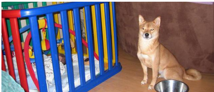
Barnevakten passer på at babyen sover og har det bra.

Dette er selvfølgelig noe vi tar hensyn til. Ingen av de to eldste hundene er vant til barn fra de var valper.