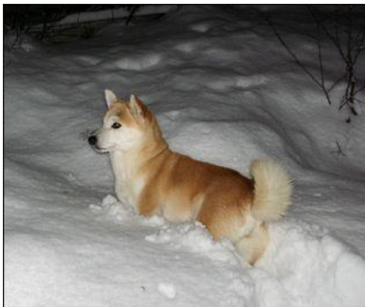
Wimba fra Oppdal ser ut til å like seg i snøen.