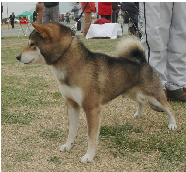
Sesam er den fargen japanerne anser å være vanskeligst å få korrekt. Dette er et eksempel på en korrekt sesam. Fargen kalles også viltfarget i Norge.

I utgangspunktet kan to B&T hunder kun gi B&T eller hvite valper, men det har i følge de japanerne jeg har snakket med i enkelte meget sjeldne tilfelle også forekommet røde valper i en slik kombinasjon.