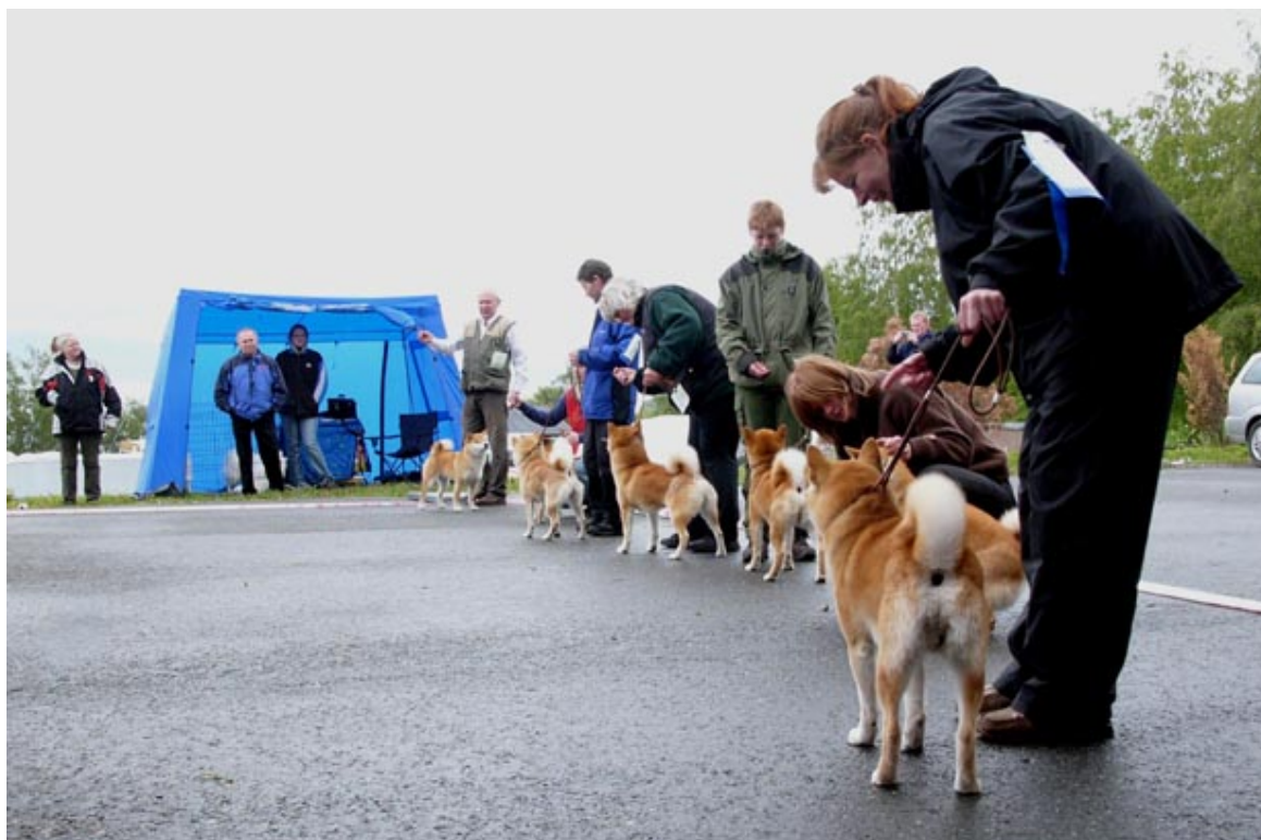
Situasjonsbilde fra Shiba-spesialen