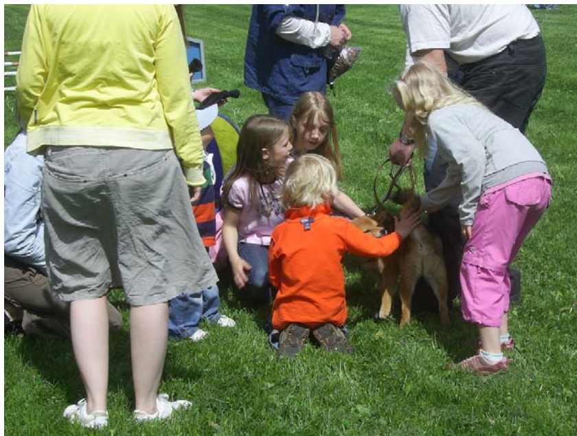
Barn koser seg

Mange forbipasserende kom innom for å se hva vi holdt på med, og ikke minst var det moro med alle de små barna som syntes at shibaen var veldig søt. Noe som vi alle kan si oss enig i.