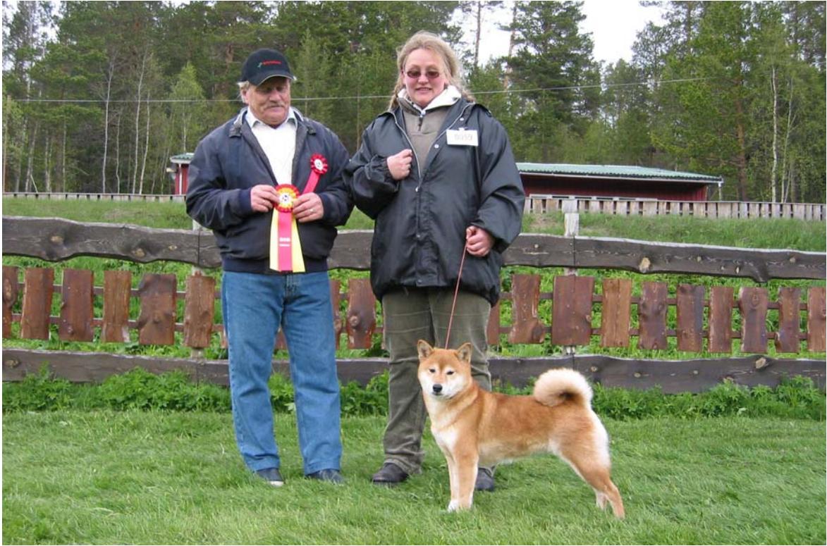
BIR veteran: N S Uch NV-00 Soldoggen's Chimpira