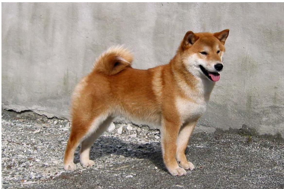
We-Sedso Unryu.( Ryu)