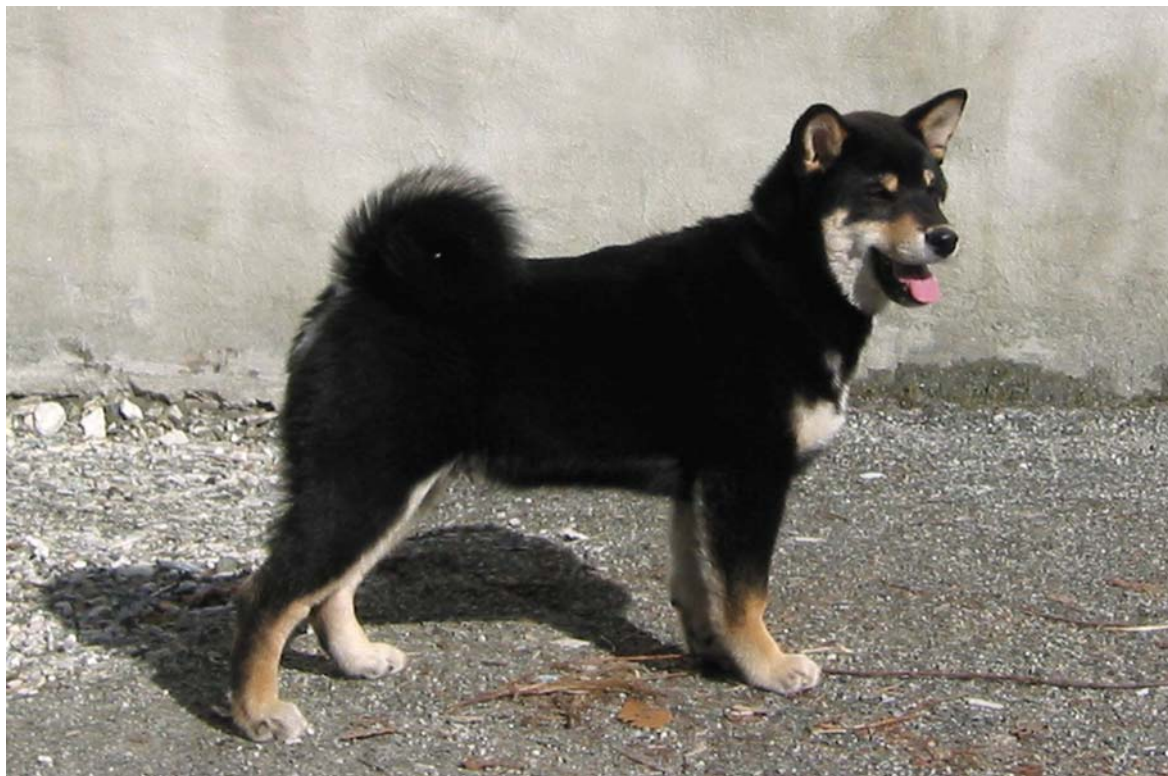
Honto No Yushin Kuro ( Waka)