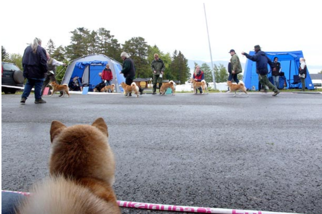
Jeg vil også være med i Shiba-spesialen!