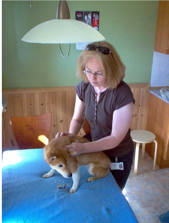
Godt i gang med masseringen. HmMMM. Nydelig.