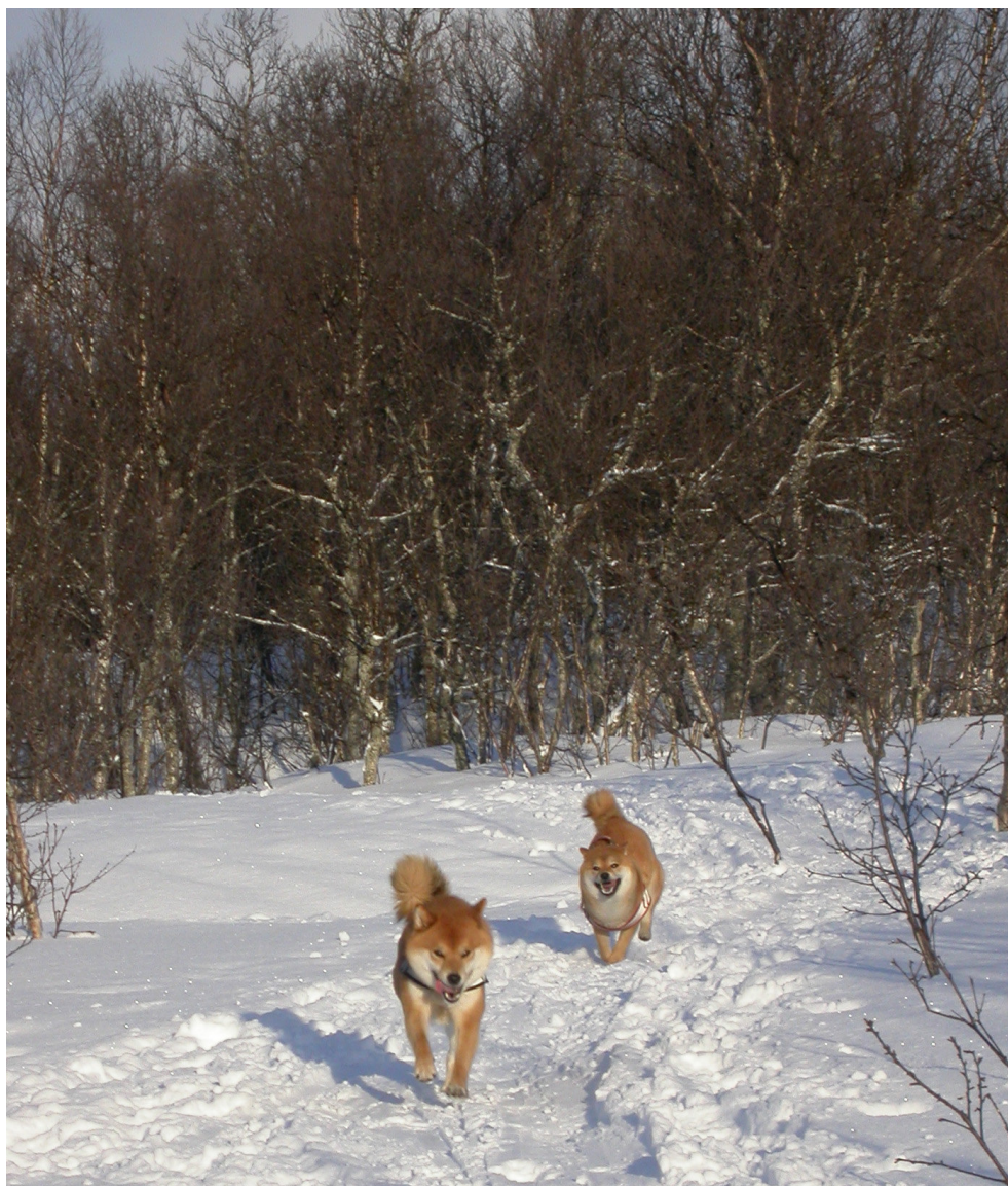
Yoshi og Aicha nyter vinteren!