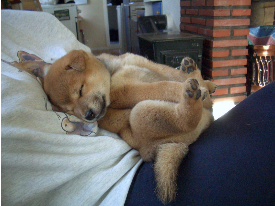
Deilig med en liten lur.....