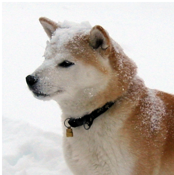
Zenmai av Enerhaugen