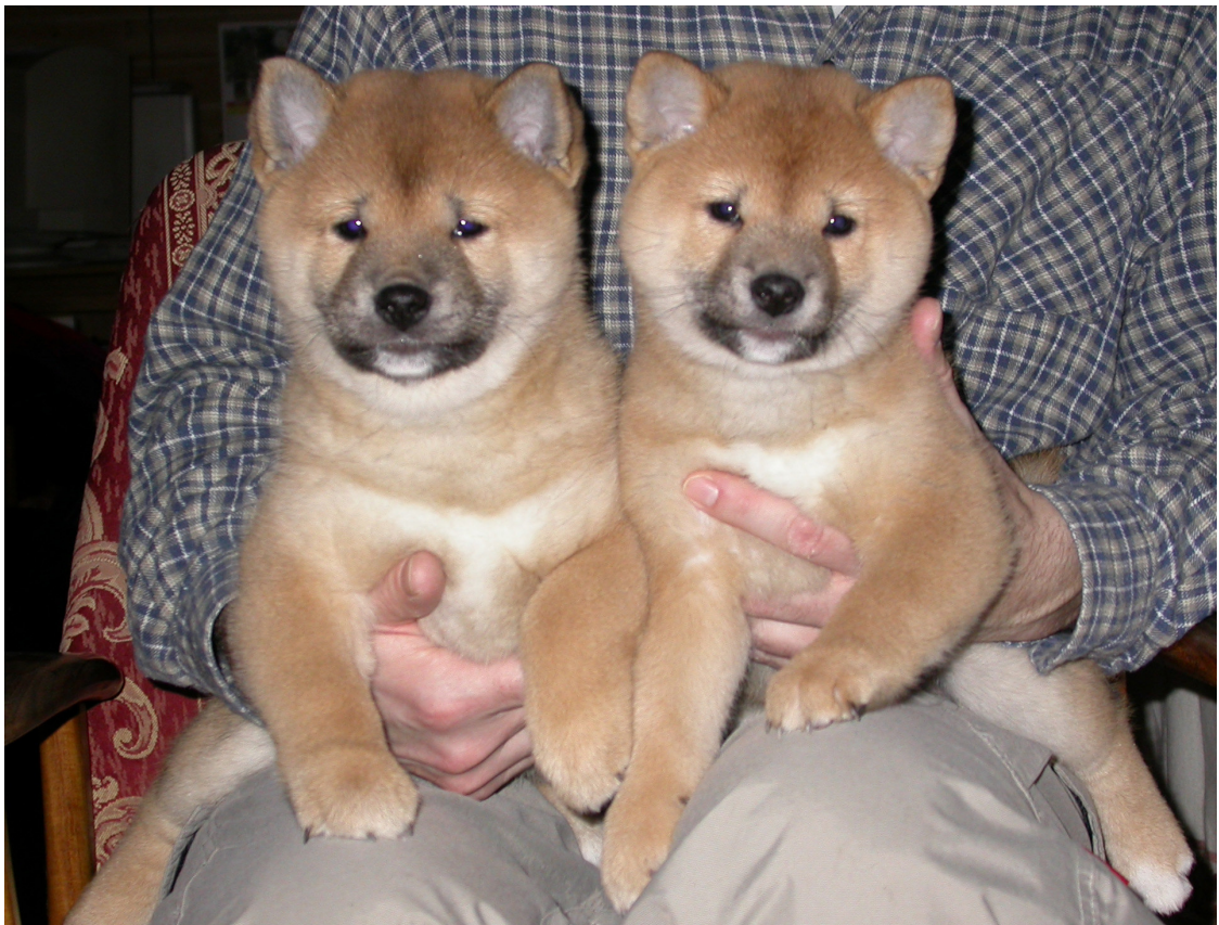
To fine søstre