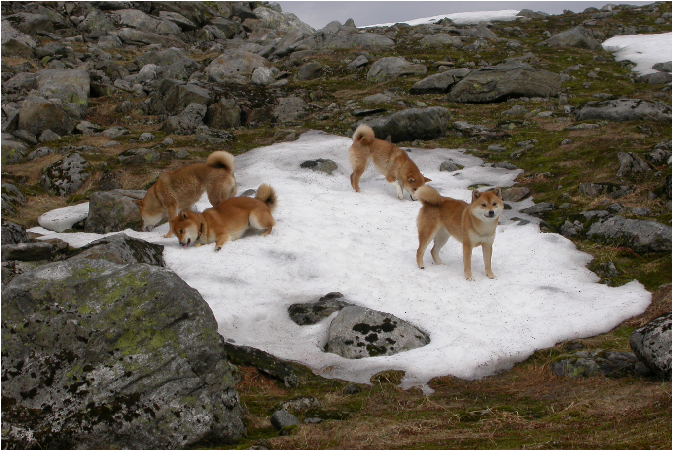
Og snart blir det vår!