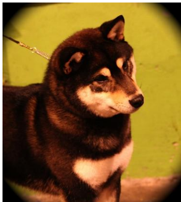
Ølenskjold's Hachiko ( Asa x Aya )