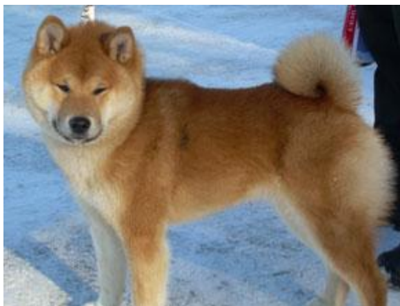
Ølenskjold`s Baron Rag ( Sniffen x Tenshi )