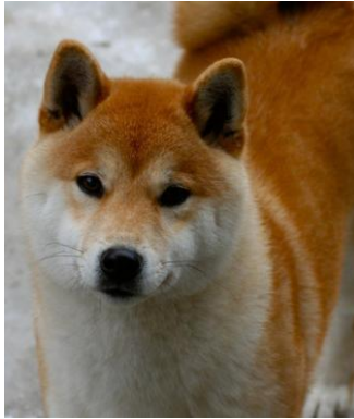
NORDJV10 Ølenskjold's Emma ( Balder x Betsy).

Dessverre fikk Emma en altfor kort karriere og er nok den shibaen som jeg per dags dato har hatt størst og mest tro på. Hun hadde også et herlig vesen og hadde et ypperlig shibatemperament.