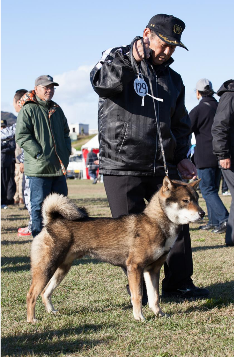
BIS NIPPO Grand National 2012; Shikoku, IYO NO GAKUSHUN