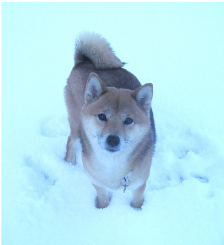
Dette er min 6 år gamle shiba. Hun heter Yuna.

– Har du hatt det greit i barnehagen i dag? Har du møtt noen kjekke hunder? spør hun når Soto leveres etter barnehagen. Det er ikke bra for oss å være altfor mye alene, og det gjelder for hunder og.