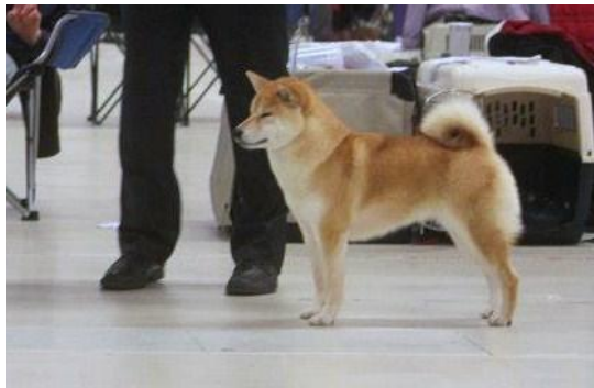
NORDV12 DKV12 Ølenskjold`s Eiko ( Balder X Betsy )

13 x BIR, 1 x BIM, 1 x BIS2, 1 x BIG ,1 x BIG2, 2 x BIG3 , 3 x Cacib ,15 x Cert,