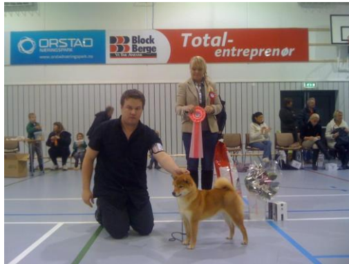
NV12 Fujizakura av Enerhaugen ( Koki x Tadako ) Norsk Vinner 2012 2 x BIR, 1 x BIM, 3 x CERT, 1 x CACIB

Andre hunder fra vårt oppdrett som har klart å ta cert på utstillinger er : Ølenskjold`s Hanako.