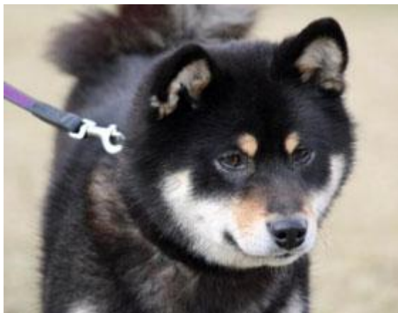
Nuch Ølenskjold`s Chita ( Sacho x Tenshi )