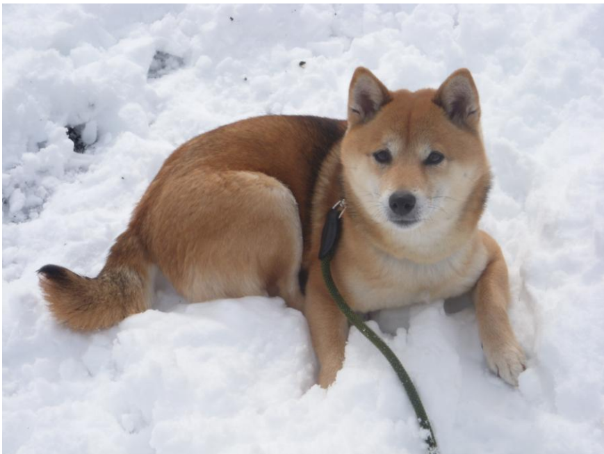
Yuna i snøen

All vintersport er ikke for hunder. En krasj i akebakken kan få alvorlige skader akkurat som blank is på skøytebanen. Morsomt for Bambi, men stor ulykkesrisiko for hunden.