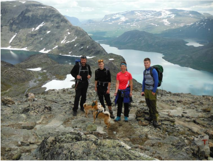
Med Besseggen i bakgrunn.