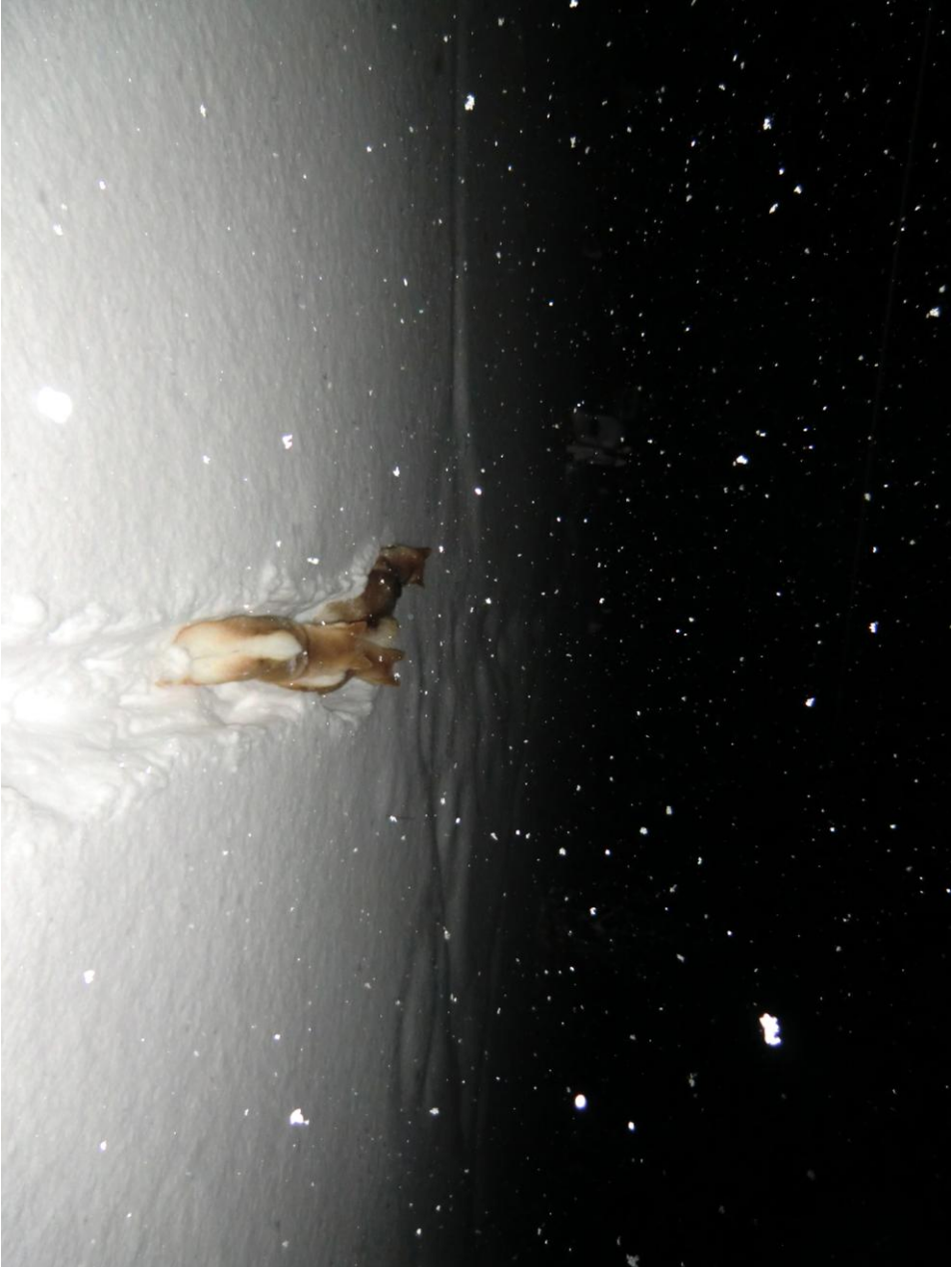
VINTERSTEMING FRA OPPDAL