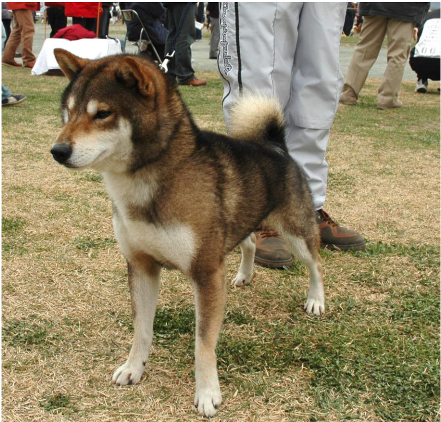
Korrekt sesamfarget shiba fra Japan

Det står: Sesame (sorte hårspisser over dyp rød pels) med klart definert Urajiro ( kremfargede kontraster) Sorte hårspisser jevnt fordelt på hodet og kroppen. Ikke konsentrert slik at det dannes sadel eller mørke (ensfargede) flekker. De sorte hårspissene skal dekke minst halvparten av kroppen. På hodet skal de være ned i pannen som en "djevlehue" mens snuten skal være rød. Feltet over øynene er enten rød eller kremfarget. Fremføttene er røde opp til albue og bakføttene er røde opp til hasene.