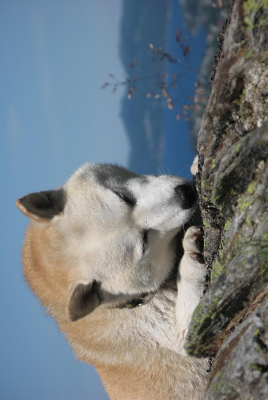
En avveksling fra alle oppstillingsbilder; Zenmai nyter livet på fjellet.