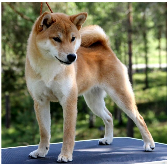
BIR valp: Sutamuroko Nikko