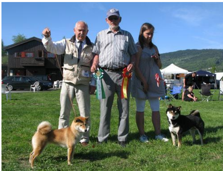
BIR: Kazakoshi No Kuronishiki Go Yokohama Atsumi