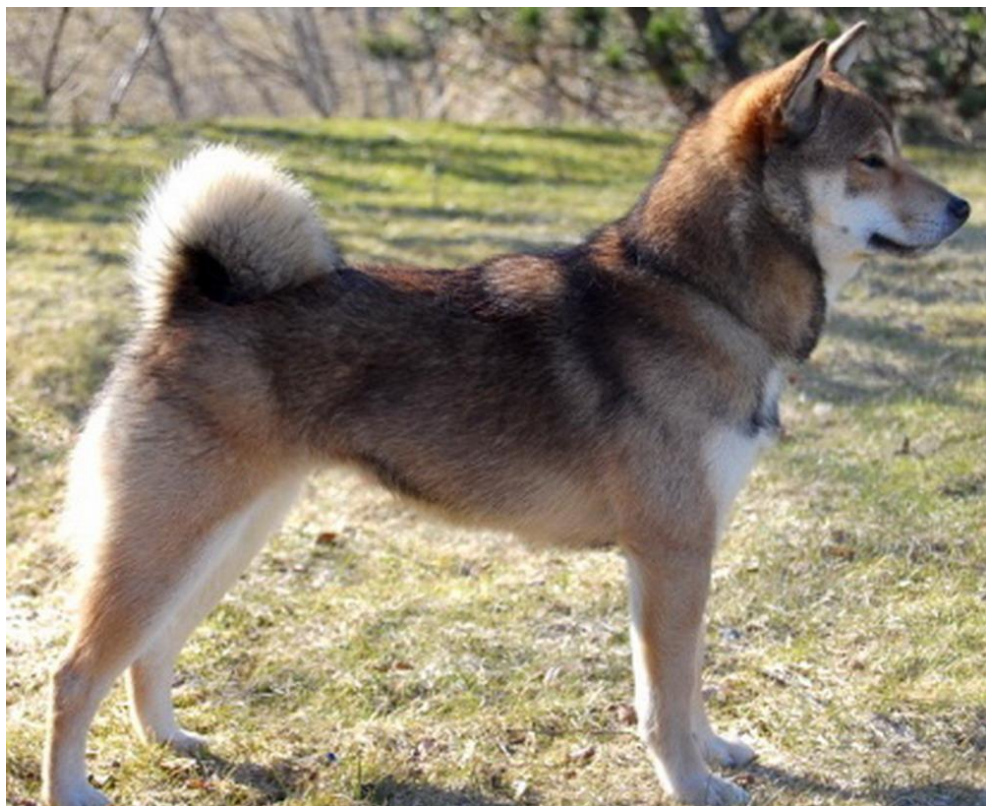
Korrekt sesamfarget shiba fra Norge