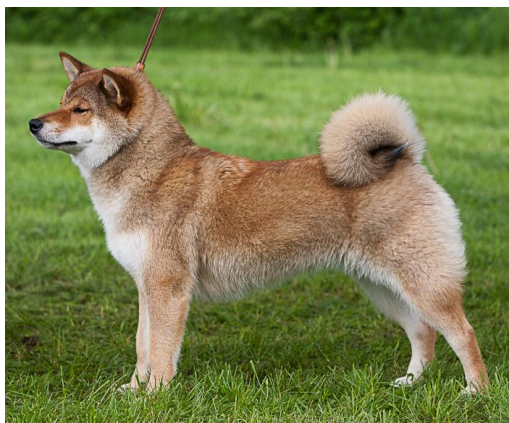
Asa No Daisuki Go Av Enerhaugen NO55898/10, 02/09/10, Rød/Krem E/O: Lang, Christen 5035 Bergen (N UCH Honto-No Daimaruou - Asa No Kuro Suzuka Go Av Enerhaugen)

Nive female Good cond Could be more comp Fem head Little loose skin Could be stronger back Corr ang Good coat Move well E 4JJK