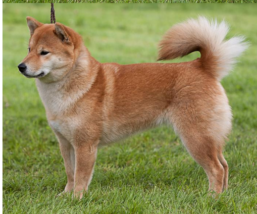
Noven's Ebetsu Ori SE15262/2010, 14/01/10, Rød E: Nordberg Roar A/ Eriksen Beate S O: Noven, Elisabeth, Sverige (SE UCH Stämmlock's Etsuo - S N UCH NORD-08 SV-09 NV-09 Novens Takara)

Nive female Good cond Could be more comp Fem head Little loose skin Could be stronger back Corr ang Good coat Move well E 4JJK