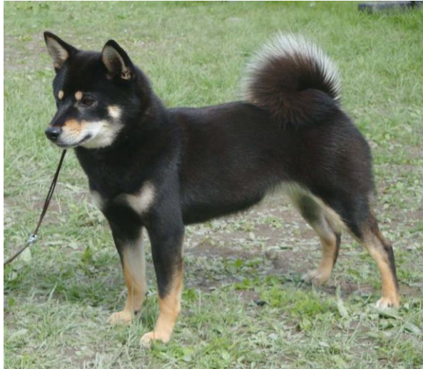
Nr 2. 16 poeng Negi-Inu's Li-Qu Yoshi With Kichiko Eier: Ulleberg-Bøhmer/Schyttelvik