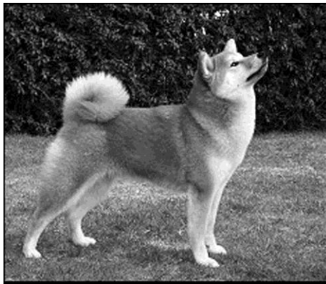
Tæve : Fuma-Ki Airashii / Karin Bankov