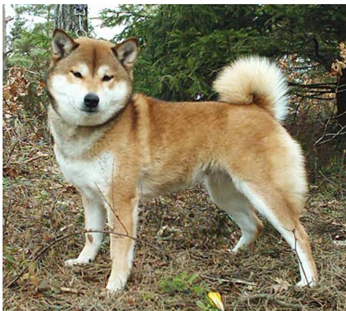
Nr 2. 16 poeng N DK Uch NV-01 Ramnfløya's Kita No Otenba