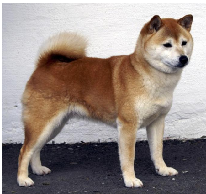
Nr 3. 15 poeng SUCH NUCH VWW-08 Honto-No Zen-Ya