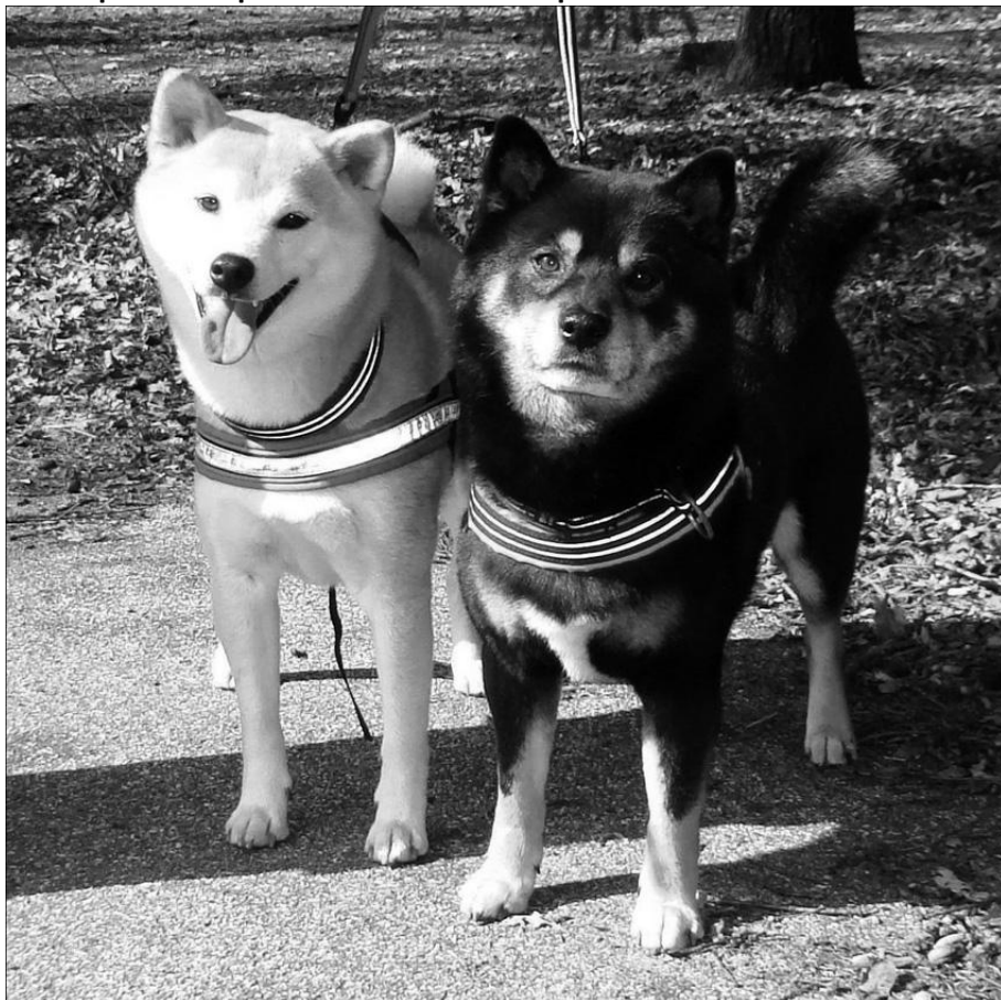
Okami's Daiju / Pernille Strikert Nidhøg's Uyoshi / Pernille Strikert