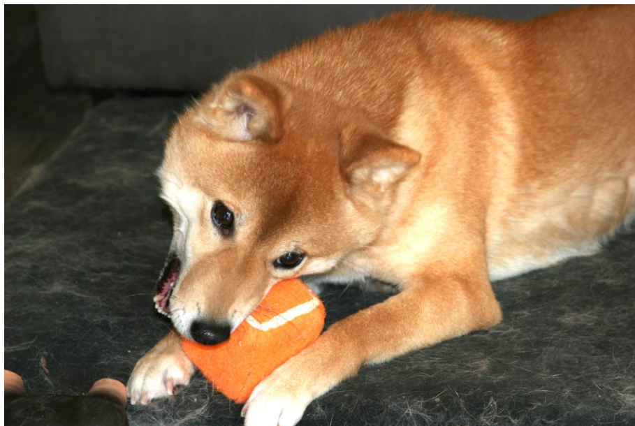
Med friske tenner er det ingen kunst å avlive en tennisball på under 2 minutter...

Kanskje du skal ta en titt i munnen på din pelskledde venn, og se om alt står bra til!