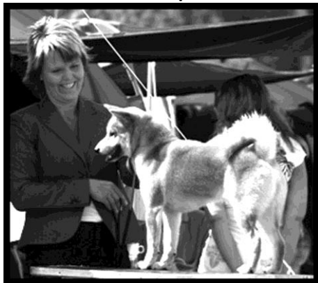
Han : Yamazakura's Fujiyama / Joan Bach