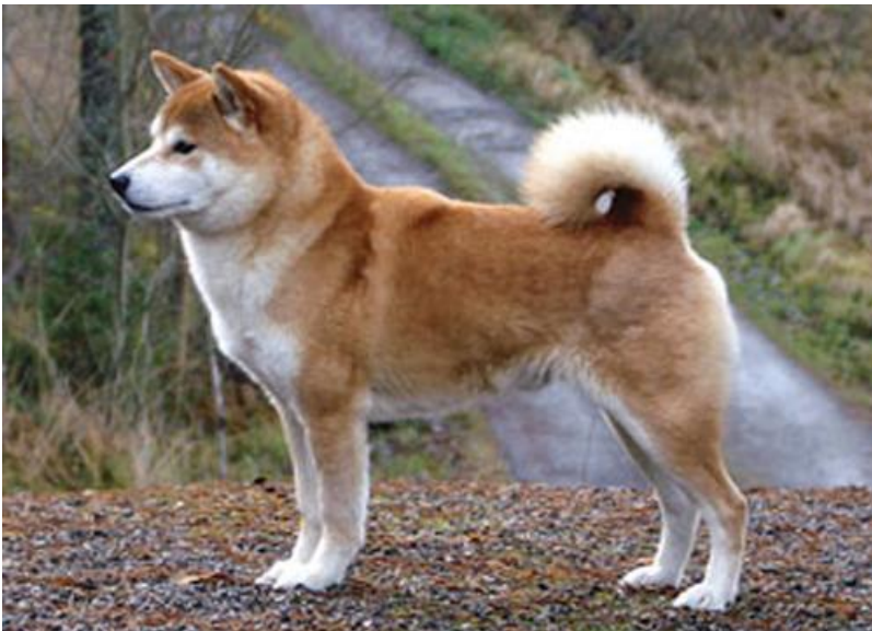
Nr 1. 18 poeng AM CAN S N DK NORD UCH NV-03 San Jo Lucky In Love Eier: Nordwall/Lang