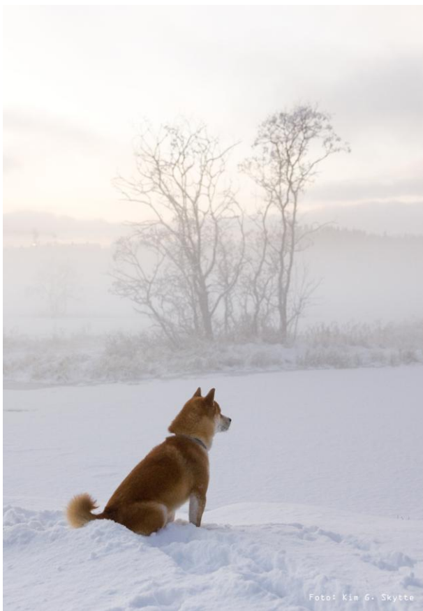
Vinner bilde fotokonkurranse

Det var påmeldt totalt 71 shiba som ble bedømt av Kari Granaas Hansen. Total påmelding sammen med rasene Akita, American Akita, Japansk spisshund og nytt i år Shikoku, var rekordhøyt: 111 voksne + 11 valper. Vi måtte derfor bruke to dommere/ringer. Deltakere fra Norge, Sverige og Danmark fant veien til Hunderfossen. Shiba spesialen vil nå bli fast avholdt på Hunderfossen hvert år.