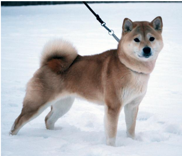
Nr 3. 35 poeng N S Uch Soldoggen`s Ichi Aki-Kaze