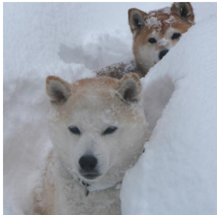
Zenmai og Aya i snøen

WWW.HUNDOGHELSE.NO Passord: "SHIBAHELSE"