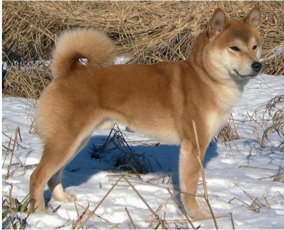
Nr 2. 54 poeng N S Uch.Tenko Av Enerhaugen Eier: Eirik Knudsen