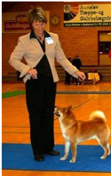
Yamazakura's Fujiyama BIR Nyborg