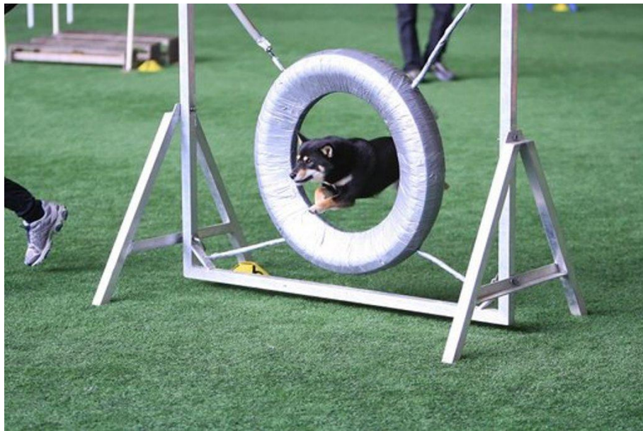
Nr 3. 10 poeng Negi-Inu's Li-Ko Kurojo (Agility/Hopp) Foto og fører Lise Kommisrud