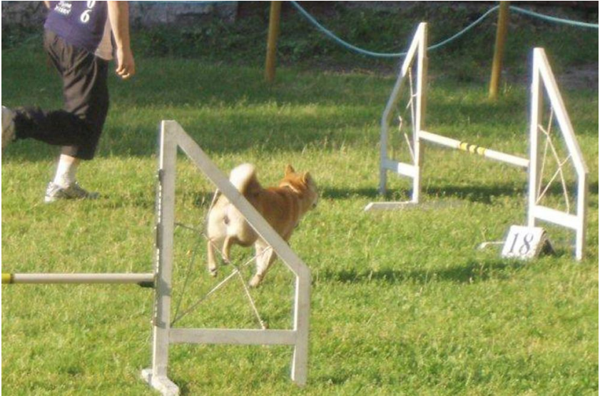
Nr 1. 14 poeng Kinu Hana Iris (Agility/Hopp) Fører: Iselin Pedersen